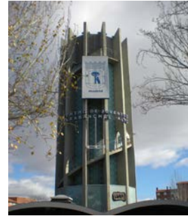
CJ Carabanchel Alto. C/ Alfonso Fernández, 23. actividadescarabanchel@gmail.com 91 400 64 17