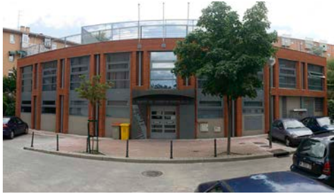
CJ Hontalbilla. C/ Hontalbilla 10. actividadeshontalbilla@gmail.com 91 734 28 78