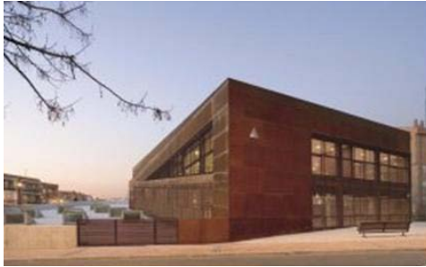
CJ El Sitio de Mi Recreo. C/ Real de Arganda c/v Sierra del Torcal. actividadeselrecreo@gmail.com 91 332 01 98