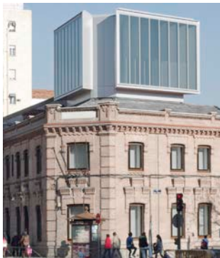
CJ Chamberí. Avda. Raimundo Fernández Villaverde 2. actividadeschamberi@gmail.com 91 535 70 10