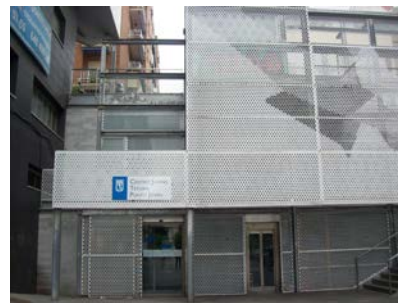
CJ Tetuan Punto Joven C/ Dulcinea 4, entrada por c/ Raimundo Fernández Villaverde 35 (junto ascensor) tpjparticipacion@gmail.com 915347744